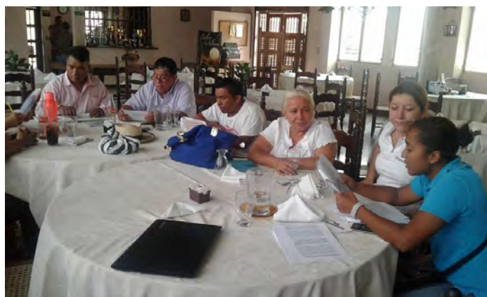
Reunión de la CODEDIS de Suchitepéquez