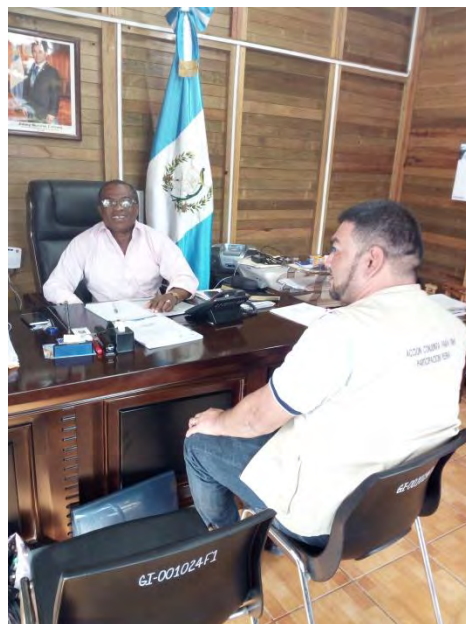
Reunión con el Gobernador Departamental de Izabal.