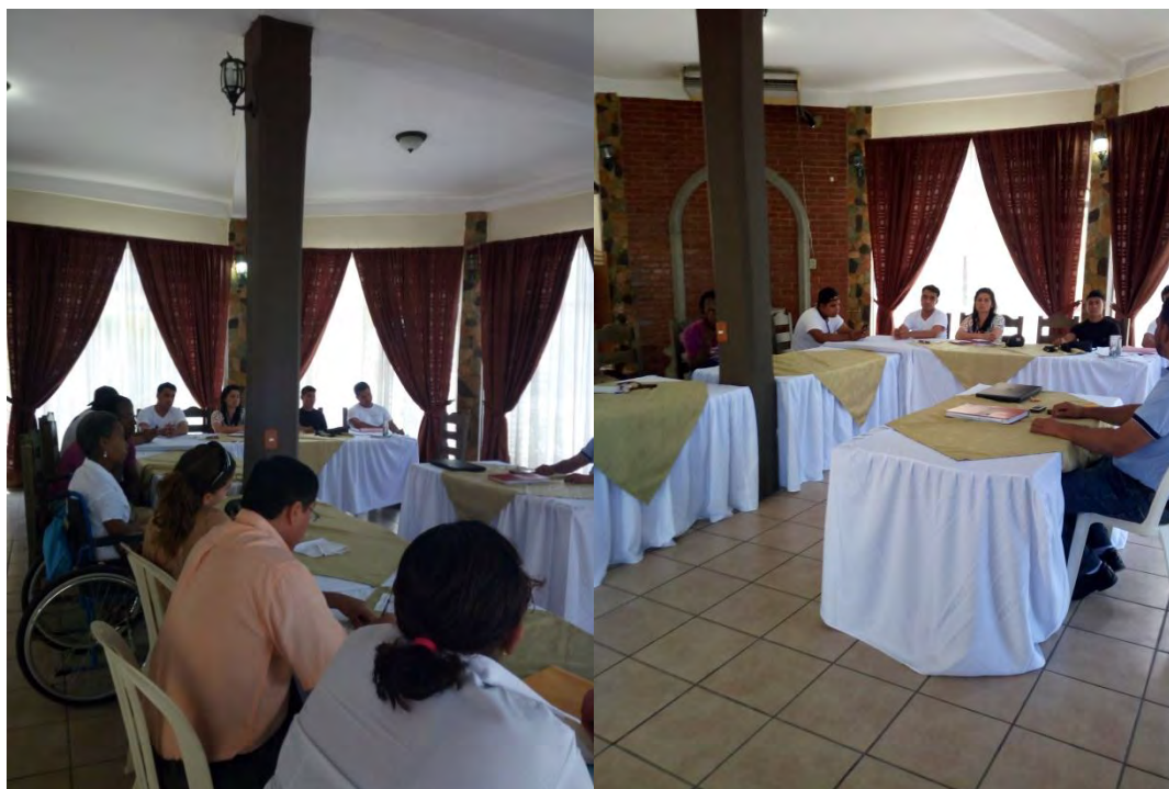
Reunión de la CODEDIS de Izabal.