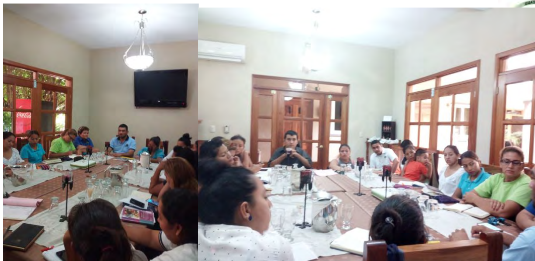
Reunión de la CODEDIS de Petén