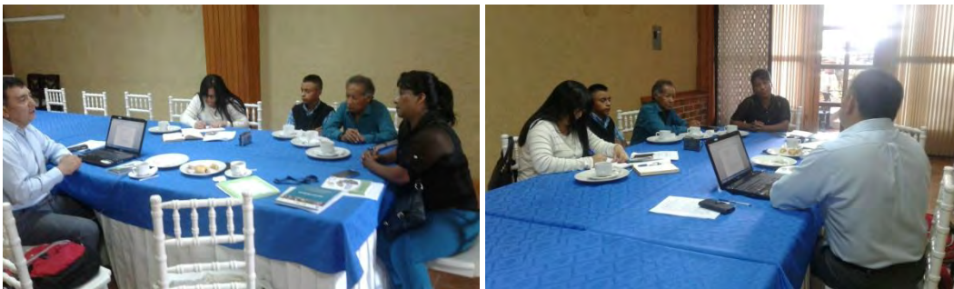
Reunión de CODEDIS de Alta Verapaz

En el departamento de Alta Verapaz se ha tenido un buen inicio ya que en la primera reunión con los integrantes de la CODEDIS se han establecido contactos con las diferentes instituciones. Conocieron el reglamento de las CODEDIS y una primera acción fue tener un acercamiento con los Diputados Distritales y, aunque es difícil de encontrarlos se tiene contacto con dos de ellos para sostener una reunión en la que conozcan el sentir de la población con discapacidad respecto a la Iniciativa que se está tratando en el Congreso de la República.