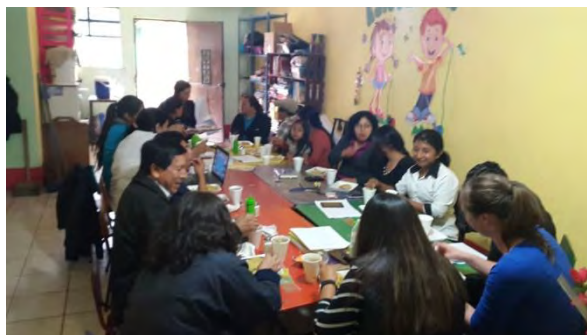
Reunión de CODEDIS de Quetzaltenango

En el departamento de Quetzaltenango, en el CODEDE, está incluido el tema con voz y sin voto.