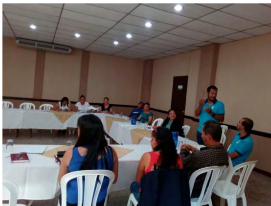
Reunión para reestructurar la CODEDIS de Jutiapa.