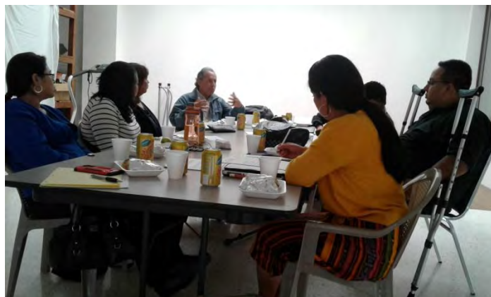
Reunión de la CODEDIS de Chimaltenango