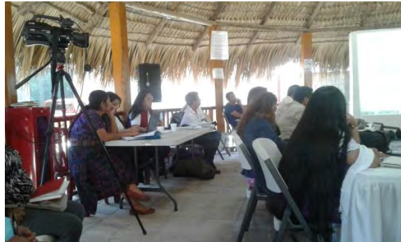
Participación en el CODEDE de Baja Verapaz

La CODEDIS pide que se pueda dar más material de apoyo para hacer incidencia ya que no se tiene leyes, políticas trefilares no otro material para darle a conocer a las instituciones de Estado y que se comprometan a trabajar con el tema de discapacidad.