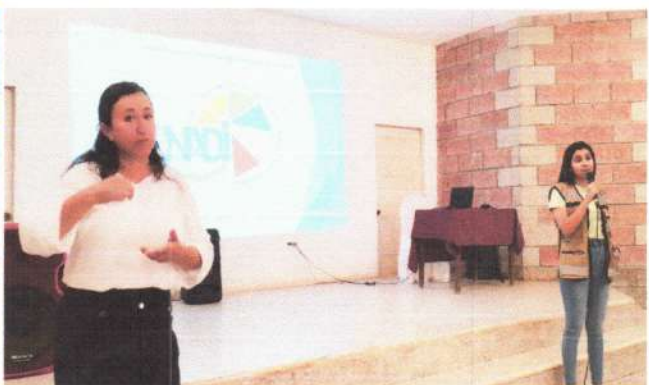
En taller Promoviendo el Ejercicio de los Derechos de las Personas con Discapacidad, Comunidades Vulnerables y Pueblos Indígenas, del Proyecto InclusiVOZ en Honduras