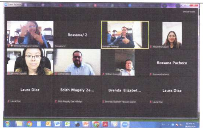
Módulo 1 Capacitación sobre Ajustes Razonables para la Inclusión Laboral en la Mesa de CONJUVE