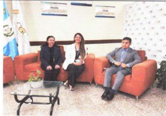
En Conversatorio “Formación y sensibilización para la inclusión de los ciudadanos con Discapacidad en las Entidades Públicas” en Contraloría de Cuentas zona 2.