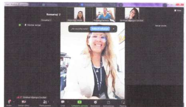
Reunión Virtual de coordinación CONJUVE-CONADI