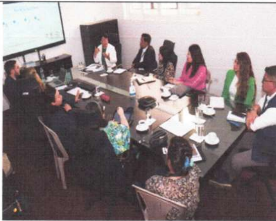
Con la Misión de SOCIEUX tratando el tema de Inclusión laboral de las PCD