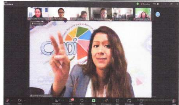
En Curso de Lengua de Señas para Delegados Departamentales