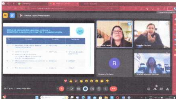
Reunión Virtual de coordinación con CENTRARSE