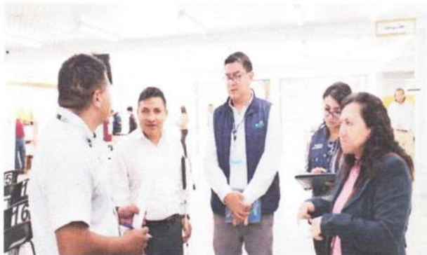
Visita técnica a RENAP zona 9