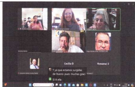
Reunión virtual en el CNE