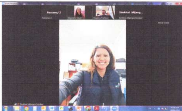
Reunión de coordinación con CONJUVE